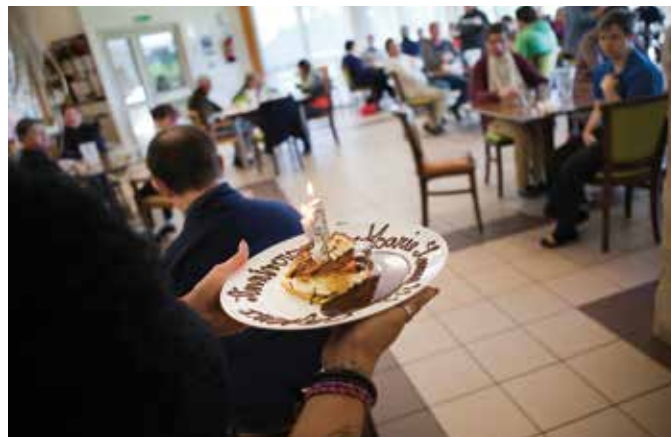
Tout est mis en œuvre dans les Maisons pour renforcer le lien social entre les résidents.