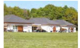
> Foyer d'accueil médicalisé Chardon Blanc

62 résidents 50 professionnels 7 unités de vie 24h/24 7 jours/7 365 jours/an