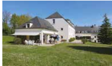
> Foyer de vie – Chardon Bleu

LA MAISON PERCE-NEIGE DE LA CHAPELLE-SUR-ERDRE FOYER DE VIE DE 34 PLACES, ACCUEIL DE JOUR DE 6 PLACES ET Foyer D'ACCUEIL MÉDICALISÉ DE 22 PLACES