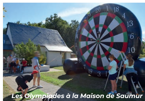
Les Olympiades à la Maison de Saumur

MAISONS DE BARACÉ, COLOMBES, COURBEVOIE ET LA CHAPELLE-SUR-ERDRE