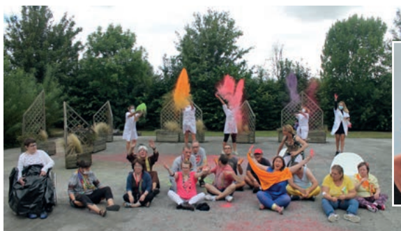
Voyage en Inde à la Maison de Maing...

En témoignent l'organisation d'un tour du monde virtuel à la Maison Perce-Neige de Maing (Nord), l'ambiance bord de mer à la Maison de Mareil-sur-Mauldre (Yvelines), des Olympiades à la Maison de Saumur (Maine-et-Loire...) qui ont été des moments forts pour tous ! ■