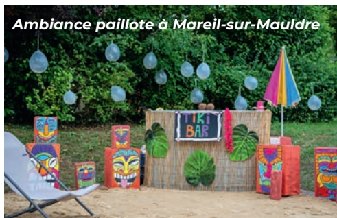
Ambiance paillote à Mareil-sur-Mauldre