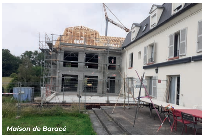
Maison de Baracé

La Fondation a programmé pour les années à venir des travaux importants dans plusieurs Maisons Perce-Neige, notamment celles de Baracé (Maine-et-Loire), Colombes, Courbevoie (Hauts-de-Seine) et La Chapelle-sur-Erdre (Loire-Atlantique).