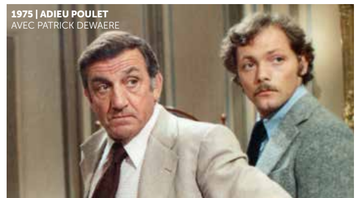
1975 | ADIEU POULET AVEC PATRICK DEWAERE