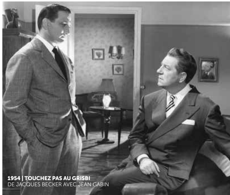
1954 | TOUCHEZ PAS AU GRISBI DE JACQUES BECKER AVEC JEAN GABIN