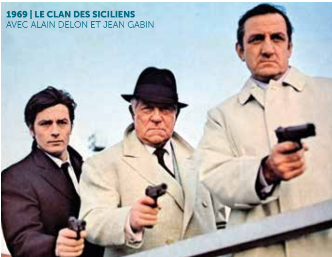
1969 | LE CLAN DES SICILIENS AVEC ALAIN DELON ET JEAN GABIN