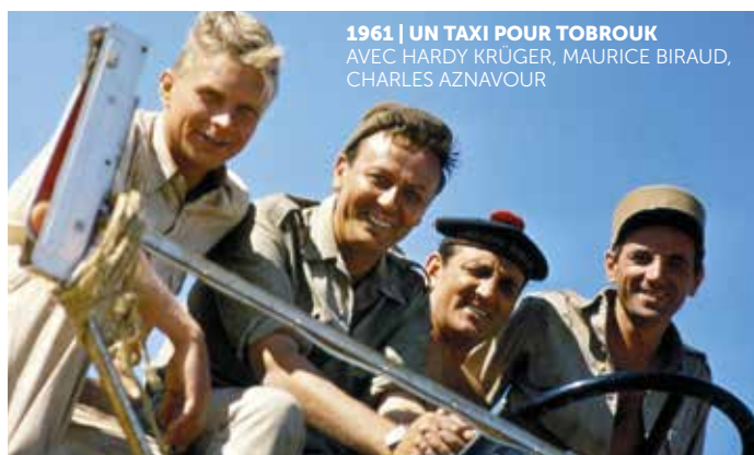
1961 | UN TAXI POUR TOBROUK AVEC HARDY KRÜGER, MAURICE BIRAUD, CHARLES AZNAVOUR

a permis de renforcer tout au long de sa carrière son jeu d'acteur avec à la clé des rôles d'anthologie comme celui de Fernand Naudin (Les Tontons Flingueurs), Jean Valjean (Les Misérables), ou encore les inspecteurs Gallien (Garde à vue) et Le Goff (Le Clan des Siciliens).