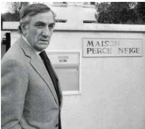
1982 | INAUGURATION PAR LINO VENTURA DE LA PREMIÈRE MAISON PERCE-NEIGE À SÈVRES (92)

Le fondateur de Perce-Neige aurait eu 100 ans cette année. Pour célébrer cet anniversaire, nous avons souhaité partager avec vous l'histoire de Lino Ventura, devenu une des personnalités préférées des Français. Portrait d'un homme qui a su mettre sa notoriété au service des personnes handicapées, de leurs familles, tout en imaginant dès les années 60 une réponse pérenne à un enjeu majeur de société en s'appuyant sur la générosité.