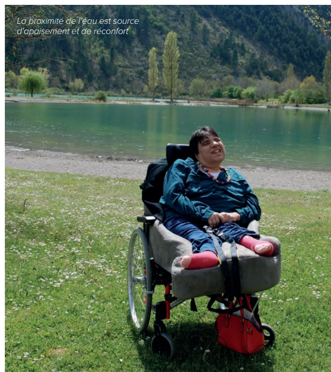
La proximité de l'eau est source d'apaisement et de réconfort

Même si la plupart des résidents n'ont pas la notion du danger, les activités en mer renforcent leur relation avec les accompagnants. « Ils sont en effet dans un univers qui peut être hostile mais savent qu'ils peuvent compter sur des personnes veillant sur eux. Du côté des équipes de Perce-Neige, c'est une grande responsabilité mais surtout une envie de faire plaisir tout en vivant ensemble des moments privilégiés. Sans l'implication des accompagnants, ce type de sorties serait très difficile. Ce qui est intéressant, c'est que ce sont les salariés qui proposent