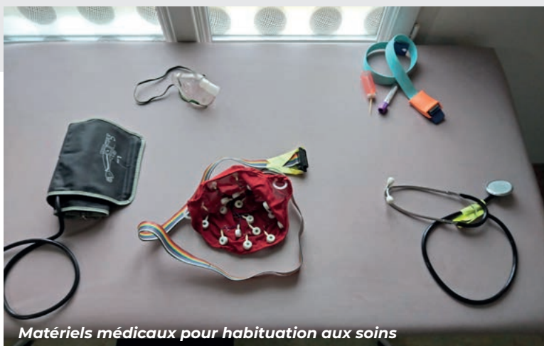
Matériels médicaux pour habitude aux soins