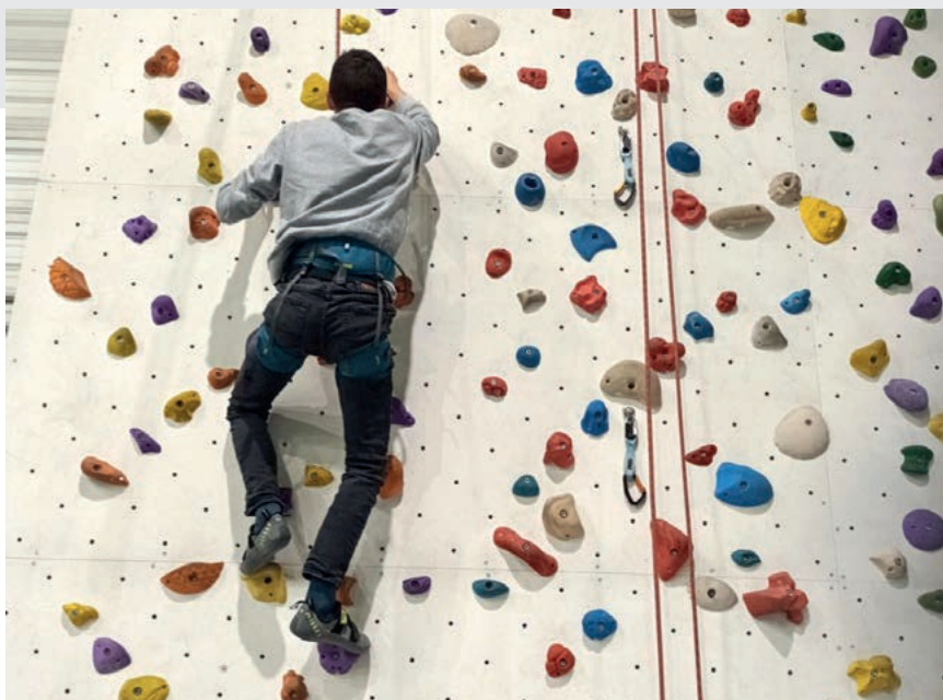
Escalade - Maison de Marseille